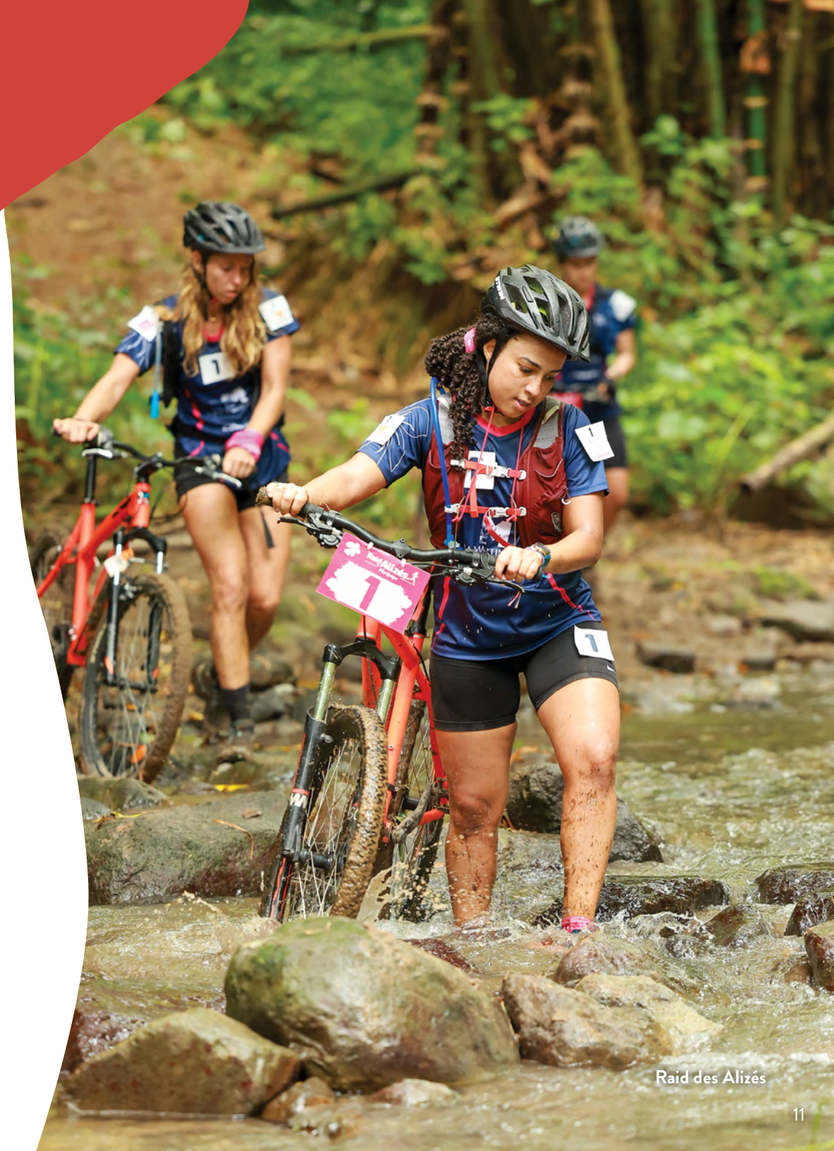
Raid des Alizés