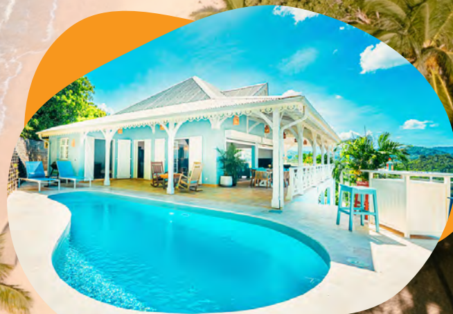
Villas Hotel Bambou